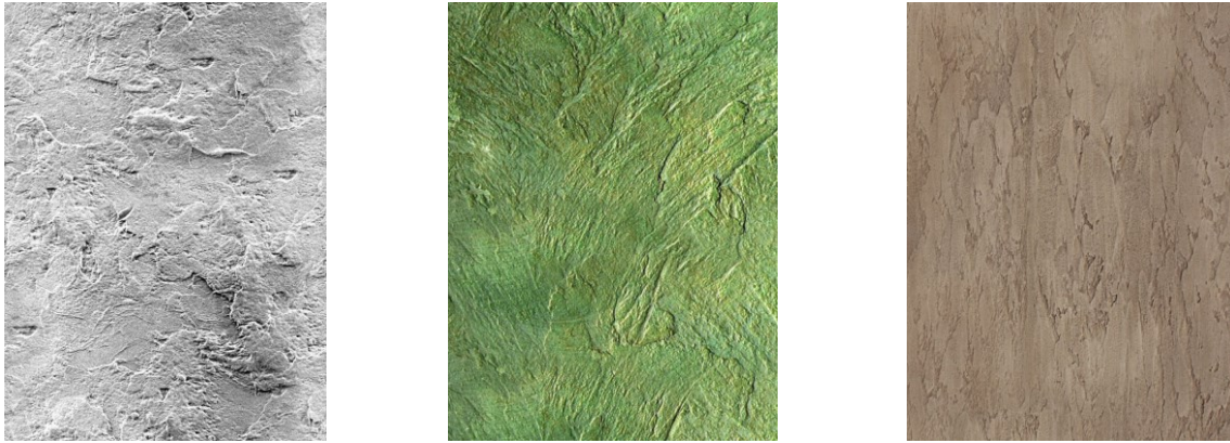
Рис. 1. Використання декоративного покриття серії DecoDer DERUFA на стіні

Для підсилення декоративного ефекту на стіні у сучасному інтер'єрі, великої популярності набирають спеціальні ґрунтовки серії DecoDer DERUFA[7], нанесення яких при дотриманні певної технології підсилюють декоративні ефекти; характеристики ефектів наведені в Таблиці 3.