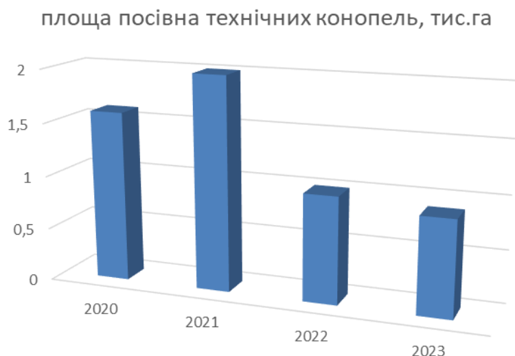
Рис. 2. Діаграма посівів технічних конопель за 2020-2023 рр. [13]

В Україні на даний час повноцінно працюють вже чотири заводи первинної переробки конопель, п'ятий — на стадії запуску. Новий завод відкривається в Черкасах, на його запуск надійшло €3,5 млн інвестицій з Німеччини. В Харкові почали випускати техобладнання для заводів з первинної переробки цієї рослини, вже перша лінія тестується на новому заводі в Черкасах, коштує така лінія близько 16 млн грн, її потужність 1 т/год.