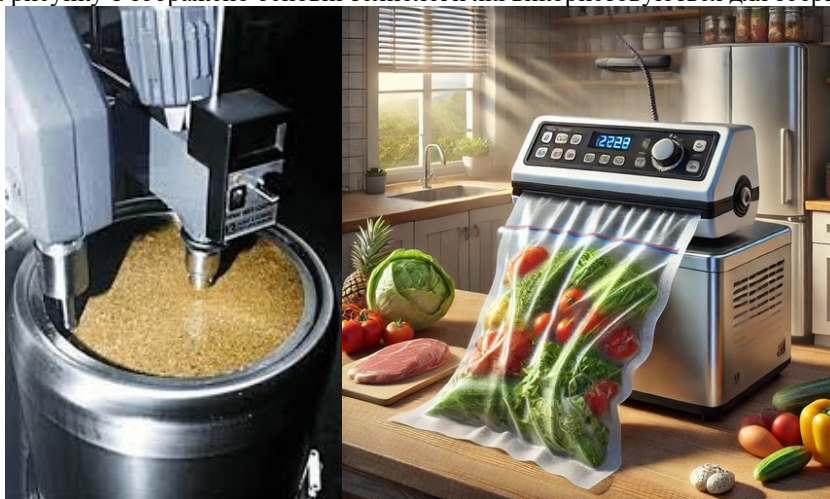
Рис. 1 Ультразвукова обробка зерна та вакуумне пакування овочів

Ще одним інноваційним підходом є використання нанотехнологій. Наноматеріали використовуються для створення пакувальних матеріалів, які мають антимікробні властивості, захищають продукцію від ультрафіолетового випромінювання та перешкоджають випаровуванню вологи. Особливо це важливо для свіжих фруктів, овочів і м'яса. Нанотехнології також дозволяють створювати датчики, які аналізують стан продуктів в режимі реального часу і сигналізують про можливі відхилення. На рисунку 1 зображено основні технології які використовуються для зберігання продукції.